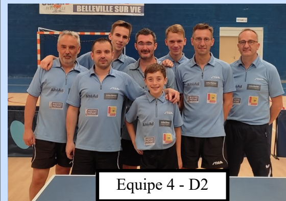
Equipe 4 - D2

L'équipe 5 en D2 se fait surprendre et perd 11 à 9 sur Fontaines-Doix 2, puis s'incline logiquement 16 à 4 sur Angles 1 adversaire qui descendait de D1 à la phase précédente.